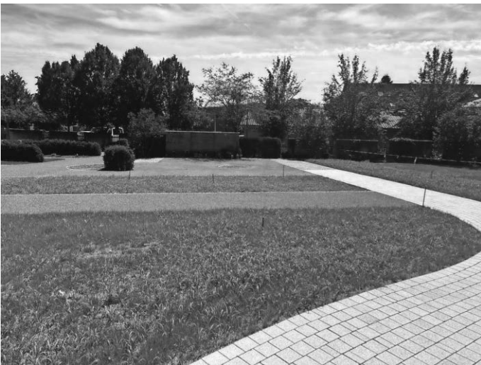
Neu angelegter Schotterrasen und neue Wege auf dem Friedhof Blitzenreute.