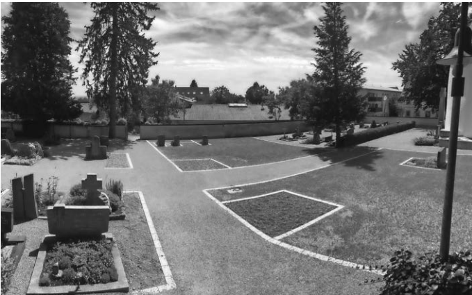
Der neu gestaltete Schotterrasen auf dem Friedhof in Blitzenreute.