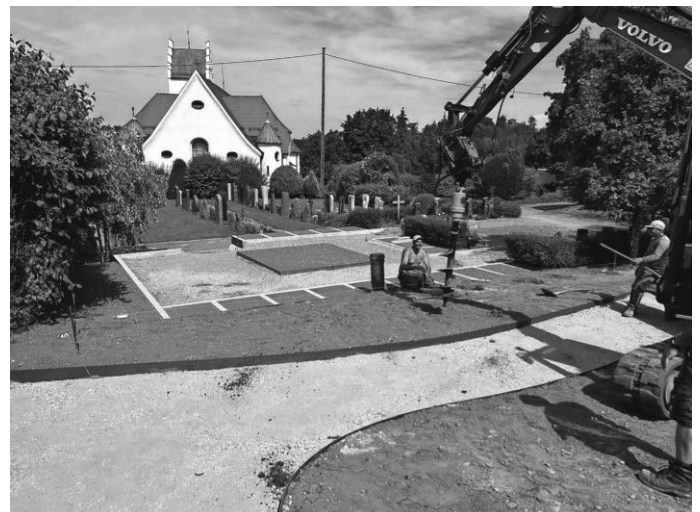
Arbeiten am Friedhof in Fronhofen.

Im Rahmen der Bauarbeiten wurden auch die Hauptwege teilweise neu gerichtet, um eine bessere Zugänglichkeit zu gewährleisten. Die neuen Wege laden dazu ein, in Ruhe zu flanieren und die besinnliche Atmosphäre der Friedhöfe zu genießen.